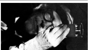
15 Mario Soldati fotografato durante i viaggi alla ricerca dei vini italiani genuini per realizzare il libro "Vino al Vino" - Anni '68 - '70 - '75