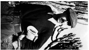
4 Mario Soldati aiuto regista di Mario Camerini nel 1936 in Africa Orientale