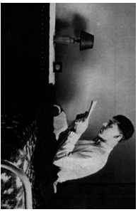
3 La cameretta che ospitò il giovanissimo professore alla Columbia University di New York. 1929