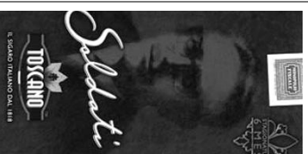
20 Nel 2006, Centenario della nascita di Mario Soldati, nasce il "Toscano Soldati" per celebrare non solo l'artista ma anche l'appassionato fumatore. Mario Soldati e il sigaro toscano sono due simboli indiscussi del Made in Italy