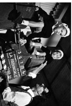
9 Sul set del film "La Provincia" con Volfrango e Michele - 1953