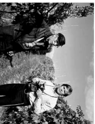
14 I viaggi di "Vino al Vino". Volfrango Soldati ha curato le immagini, come fotografo, dei primi due viaggi. Anni '68 e '70