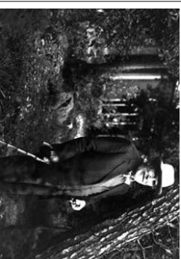
19 Mario Soldati fotografato nel boschetto di pini e lecci della sua casa di Telleraro - inizio anni '90