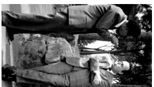
11 Mario Soldati e Giorgio Bassani si fermano a Villa Borghese 1955