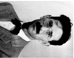
2 Ritratto di Mario Soldati. Anni Venti